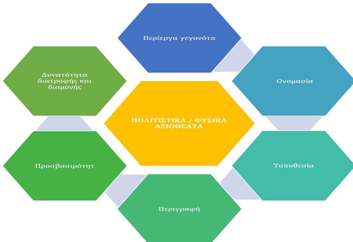
Γραφική 1. Ενοποιημένη προσέγγιση για τη συλλογή πληροφοριών σχετικά με τα πολιτιστικά και φυσικά αξιοθέατα

Λόγω της διαφορετικής φύσης των αξιοθεατών, θα μπορούσαν να διαμορφωθούν πρόσθετοι δείκτες, όπως ο χρόνος εργασίας για τα πολιτιστικά και ο δείκτης απειλούμενα είδη για τα φυσικά αξιοθέατα, αλλά η πρόταση αυτή δεν είναι υποχρεωτική και θα γίνει μόνο κατόπιν αιτήματος της Αναθέτουσας Αρχής.