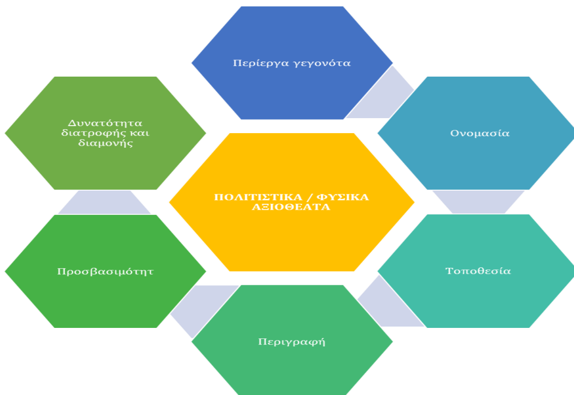
Γραφική 1. Ενοποιημένη προσέγγιση για τη συλλογή πληροφοριών σχετικά με τα πολιτιστικά και φυσικά αξιοθέατα

Λόγω της διαφορετικής φύσης των αξιοθεατών, θα μπορούσαν να διαμορφωθούν πρόσθετοι δείκτες, όπως ο χρόνος εργασίας για τα πολιτιστικά και ο δείκτης απειλούμενα είδη για τα φυσικά αξιοθέατα, αλλά η πρόταση αυτή δεν είναι υποχρεωτική και θα γίνει μόνο κατόπιν αιτήματος της Αναθέτουσας Αρχής.